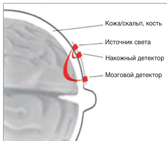
Рис. 1. Схема использования церебральной оксиметрии

В настоящее время используют несколько уникальных показателей ЦО: