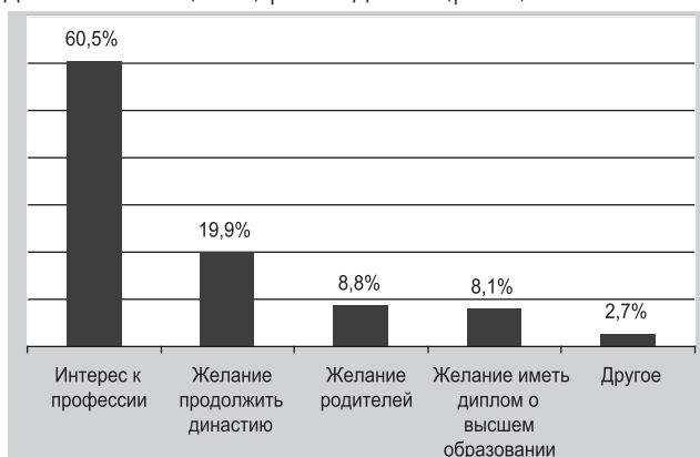
РИС. 1. Основные факторы выбора будущей профессии.

По нашим данным, основные причины выбора профессии врача у абитуриентов, пришедших на День открытых дверей, – это интерес к медицинской профессии – 89 (60,5%) человек, и желание продолжить медицинскую династию – 29 (29%) респондентов (рис. 1).